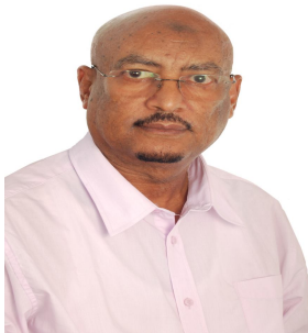
Saxeex _____ Eng. Faisal Ali Warabe Musharaxa Madaxweyne Xisbiga UCID

Ugu dambeyntii, Qorshahan Waxqabad waa mid caqli gal ah oo ay u dhan yihiin kaabayaashii farsamo (technical components) isla markaana, ka dib cilmi iyo gorfeyn dheer loo qaabeeyey si hormeysan oo hanaansan. Sidaas daraadeed, UCID waa xisbi ay u cadahay talladii iyo qorshihii uu ku hoggaamin lahaa dalkan.